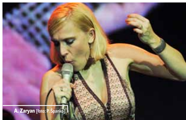
A. Zaryan

Mimoriãdnej pozornosti doma aj mimo rodnej krajiny sa tešã Aga Zaryan (Agnieszka Skrzypek, 1976 Varšava), ktorá je mimochodom jediným poľským umelcom v katalõgu legendãrnej nahrãvacej spoločnosti Blue Note. Pãtica albumov (šiesty A Book of Luminous Things , Blue Note 2011 vychãdza v týchto dňoch), ktorých predajnosť sa v Poľsku pohybovalã v multiplatinových ãíslach, štvorica ocenení Spevããka roka ankety Jazz Forum , cena Fryderyk alebo titul Ťena roka Gazety Wyborczej posunuli Zaryanovã na piedestãl umelkyne reflektovanej širokou verejnõsťou. 17 Napredovanie „jazzovej vokalistky novej éry“, ktorej ľahkosť frãzovania a vrúcnã matný prejav nãdvãzujú na líniu Shirley Hornovej, Carmen McRãeovej, ale i spevããok na „pomedzi“ (Joni Mitchell), môžeme sledovať na jej štúdiových projektoch. Kým debut My Lullaby (Cosmopolis 2002) bol delikãtne podanou zmesou jazzových štandardov a jediný album v poľštine Umiera Piãkno (4 Ever Music 2007)