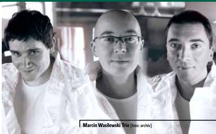
Marcin Wasilewski Trio [foto: archív]

Poľská jazzová scéna bola témou piatich predchádzajúcich kapitol, z ktorých vyplynulo, že pre Československo a ďalšie krajiny Varšavskej zmluvy plnila od polovice 50. rokov funkciu „mosta z izolácie“ do sveta jazzu. 1